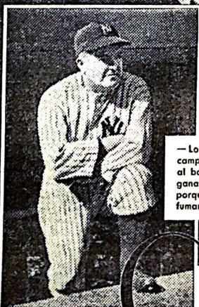
— Los Yanquis, dice JOE McCARTHY, — ganan campeonatos porque son buenos en lanzadores, al bate y en el campo . . . Los CHESTERFIELDS ganan mayor número de fumadores a diario, porque son insuperables en mayor frescura al fumar, de mejor sabor y verdadera suavidad.