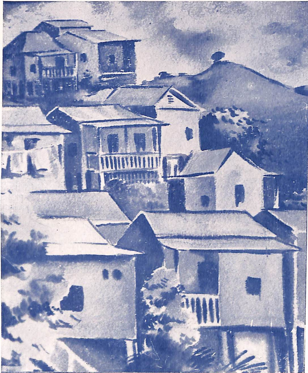
AGUADILLA por Rafael Arroyo Gely

Amada ribera nativa que luces tus joyas de monte y de mar... trigueña sultana, del cielo —tu amante— cautiva, el sol te recrea, la noche los sueños te aviva, te aguarda y te arrulla el palmar.