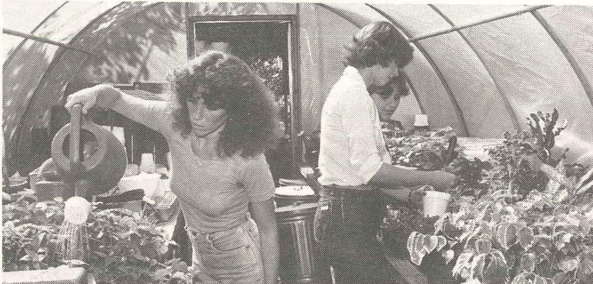
Estudiantes del Grado Asociado en Horticultura, que ofrece el Colegio Regional de La Montaña en Utuado, examinan y riegan plantas que son cultivadas en los viveros localizados en los predios contiguos a la institución universitaria.