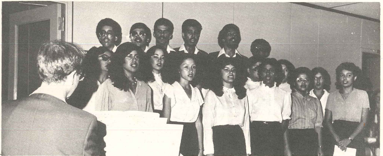
La Masa Coral del Colegio Universitario Tecnológico de Ponce interpreta varias canciones de su repertorio durante una reciente actividad celebrada en las oficinas de la Administración de Colegios Regionales de la Universidad de Puerto Rico.

Al presente hay en el Colegio Universitario Tecnológico de Ponce una matrícula de más de 1,700 estudiantes y unos 110 profesores enseñando las distintas materias académicas.